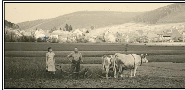
Karl und Gerda Noll beim Pflügen im Höhlchen (jetzt Dr.-Faust-Straße) um 1950

(Antragsformular liegt diesem Flyer bei)